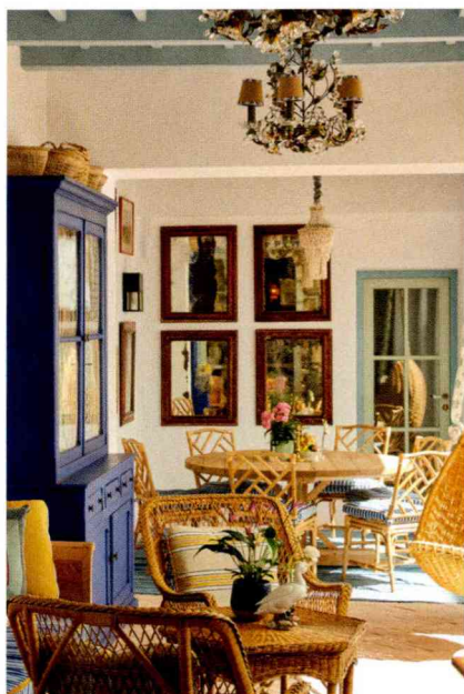
ARRIBA, EL COMEDOR, Y, A LA DERECHA, LA ZONA DE LA PISCINA Y UNA DE LAS HABITACIONES DEL HOTEL